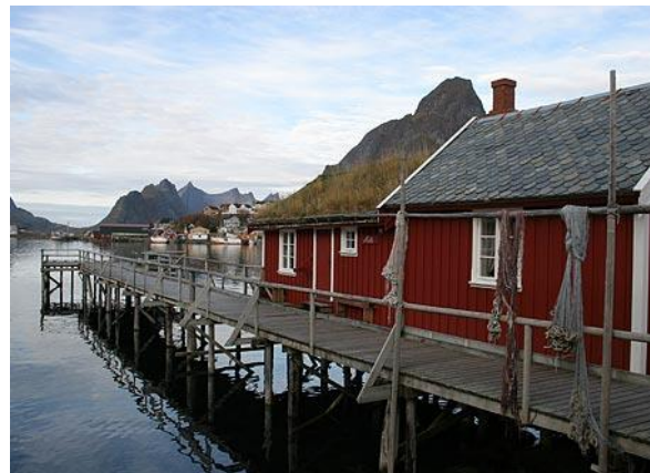
*Abendessen auf den Lofoten bei Buchung mit Halbpension