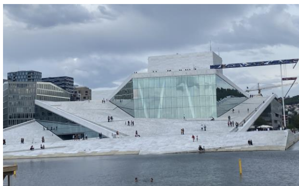
Opernhaus in Oslo

Nach dem Frühstück haben Sie noch etwas freie Zeit, um Oslo auf eigene Faust zu entdecken. Die Color Line startet die Fährpassage um 14.00 Uhr. Genießen Sie vom Sonnendeck den schönen Ausblick auf die Stadt und den idyllischen Oslofjord. Bei Buchung mit Halbpension ist das Abendbüfett enthalten.